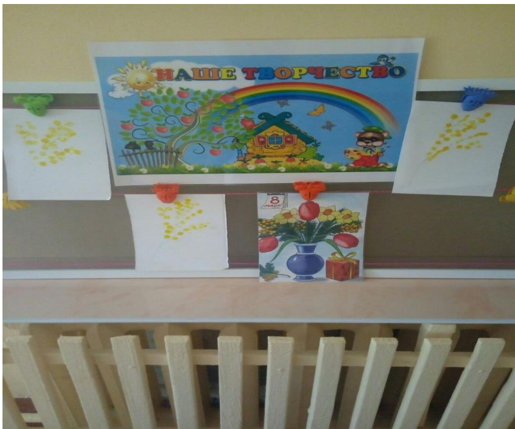
Рисование ватными палочками «Веточка мимозы»