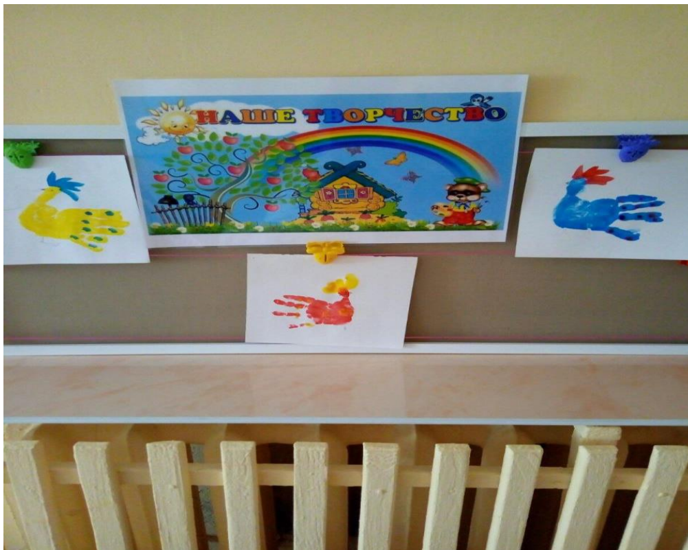
Рисование ладошкой «Сказочные птицы»